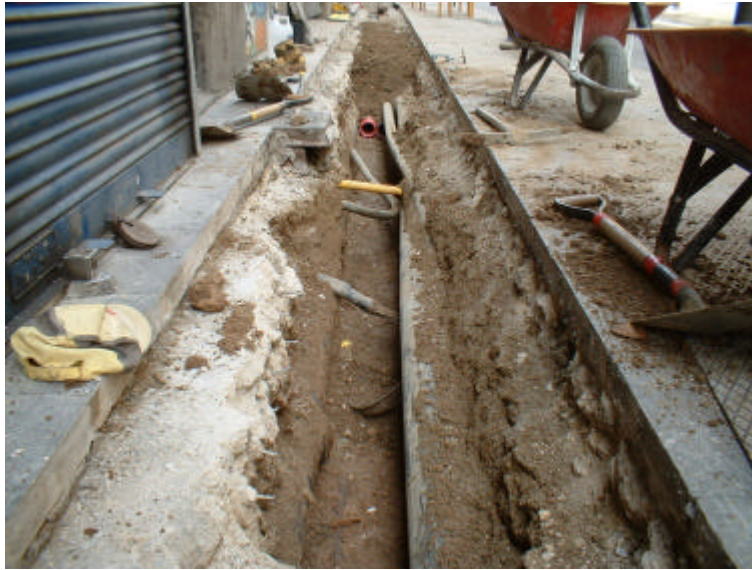
Fotografia 3: Vista parcial, amb nombrosos serveis anteriors, de la Rasa 100,