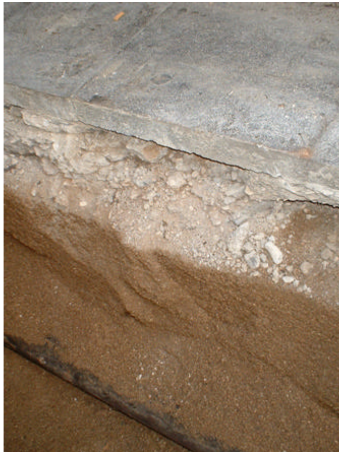
Fotografia 4: Estratigrafia de la Rasa 100.