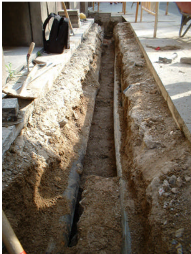
Fotografia 2: Vista parcial de la Rasa 100.