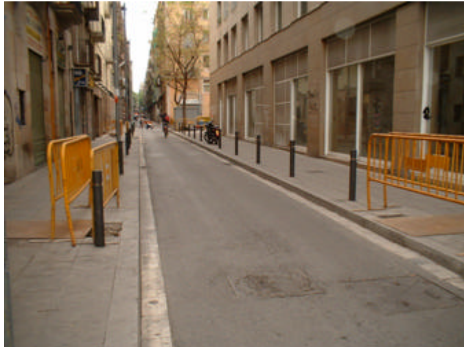
Fotografia 1: Vista general del carrer del Marquès de Barberà en el tram objecte d'aquest control arqueològic.